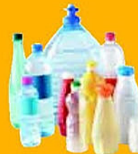
Bouteilles, bidons, flacons en plastique avec leur bouchon, y compris les bouteilles d'huile.