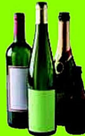
Bouteilles et flacons en verre

Je mets dans le bac des contenants propres et vides (sans bouchon, ni capsule, ni couvercle)