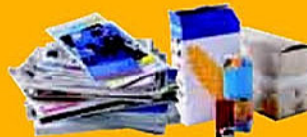
Papier, carton sans film plastique