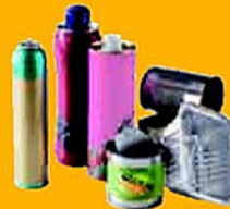
Emballages métalliques non lavés mais bien vidés de leur contenu

Je mets en vrac dans le bac (surtout pas dans un sac plastique !)