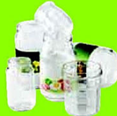
Pots et bocaux de conserve en verre

Le verre culinaire et la vaisselle en verre ont une composition chimique différente du verre d'emballage qui rend impossible leurs recyclages !