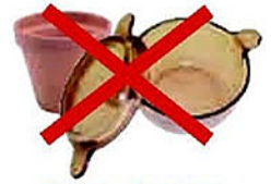
Faïence, pots en terre